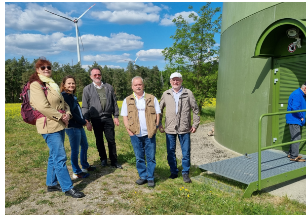
Teilnehmende an einer Windenergieanlage

>> HIER GEHT ES ZU DEN WEITEREN TERMINEN DER REIHE "BAUKULTUR VOR ORT"