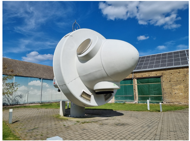
Ausstellung im Freigelände

Tauchen Sie ein in eine Welt der Inspiration im Kulturzentrum Rathenow! Anlässlich des Tages der Baukultur lädt das Kulturzentrum herzlich ein, die Konzeptausstellung "Welten verbinden - Reisen durch Träume und Realitäten" zu besuchen. Genießen Sie ein vielfältiges Programm aus Konzerten, Vorträgen und Happenings, das Kultur, Baukultur und Musik miteinander verschmelzen lässt.