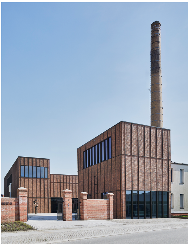
Eingang zur Kulturweberei in Finsterwalde