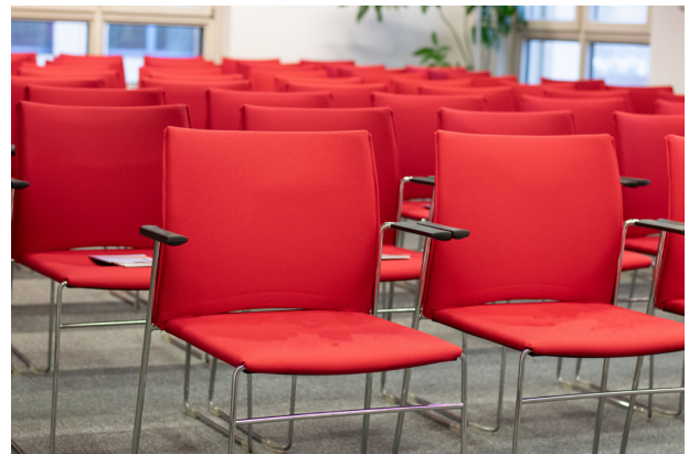
Veranstaltungsraum der BBIK

>> HIER KÖNNEN SIE SICH DAS GESETZ- UND VERORDNUNGSBLATT FÜR DAS LAND BRANDENBURG (GVBL) DOWNLOADEN