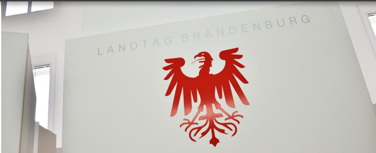
Rednerpult im Plenarsaal des Landtages