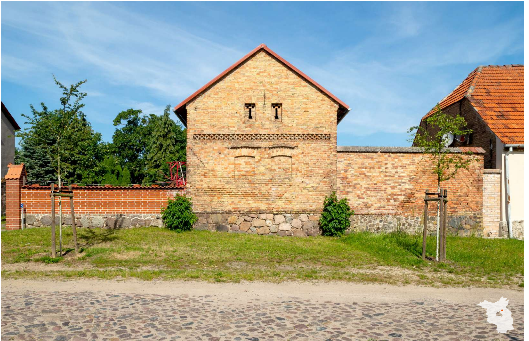
Chorin Choriner Dorfstraße