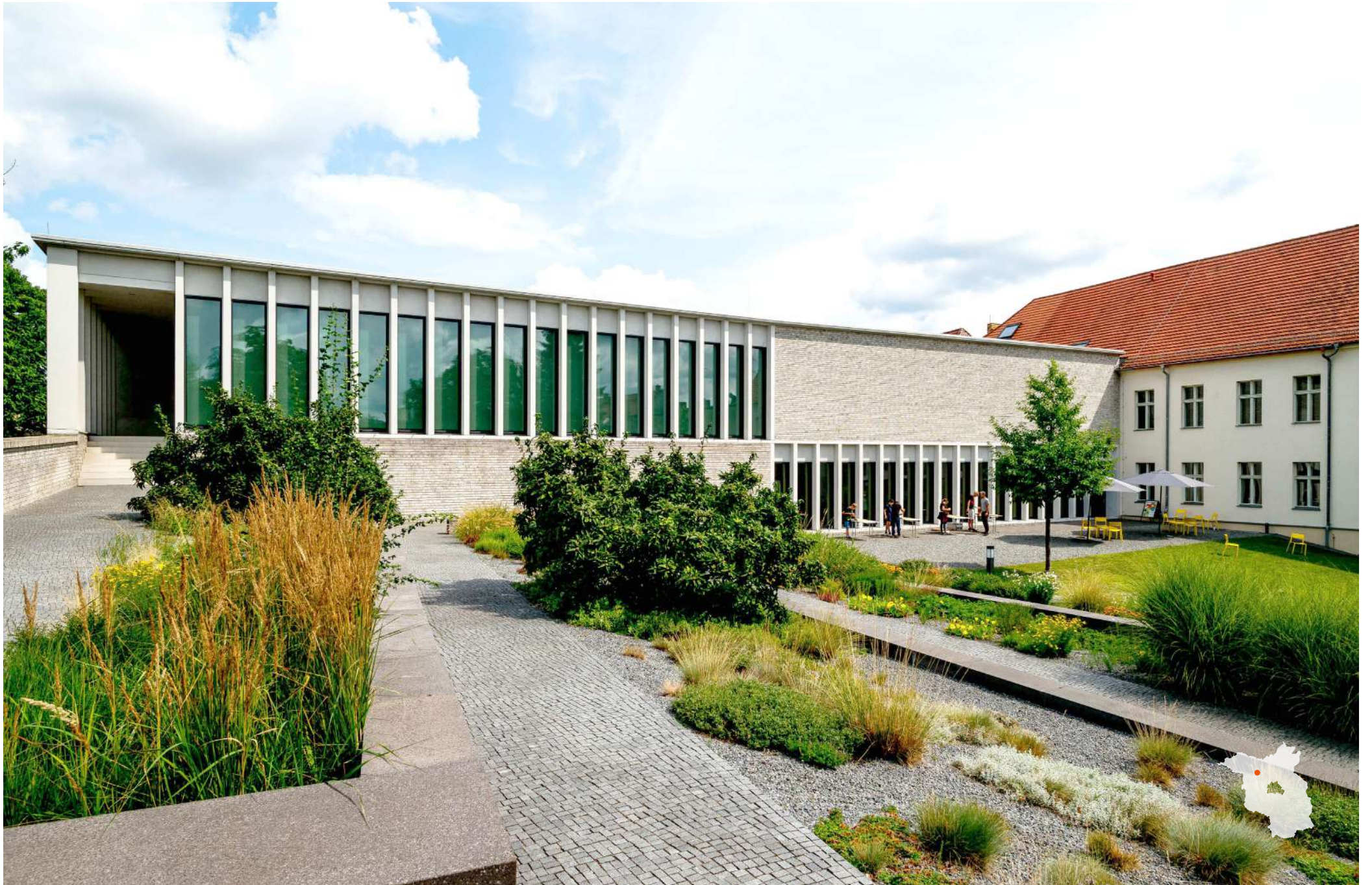
Neuruppin Museum Neuruppin