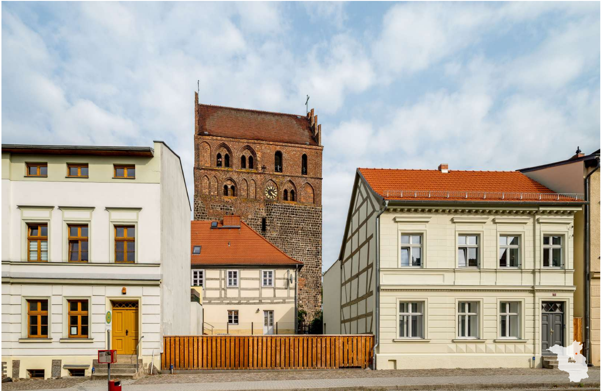
Angermünde Baulücke mit Blick zur Stadtpfarrkirche