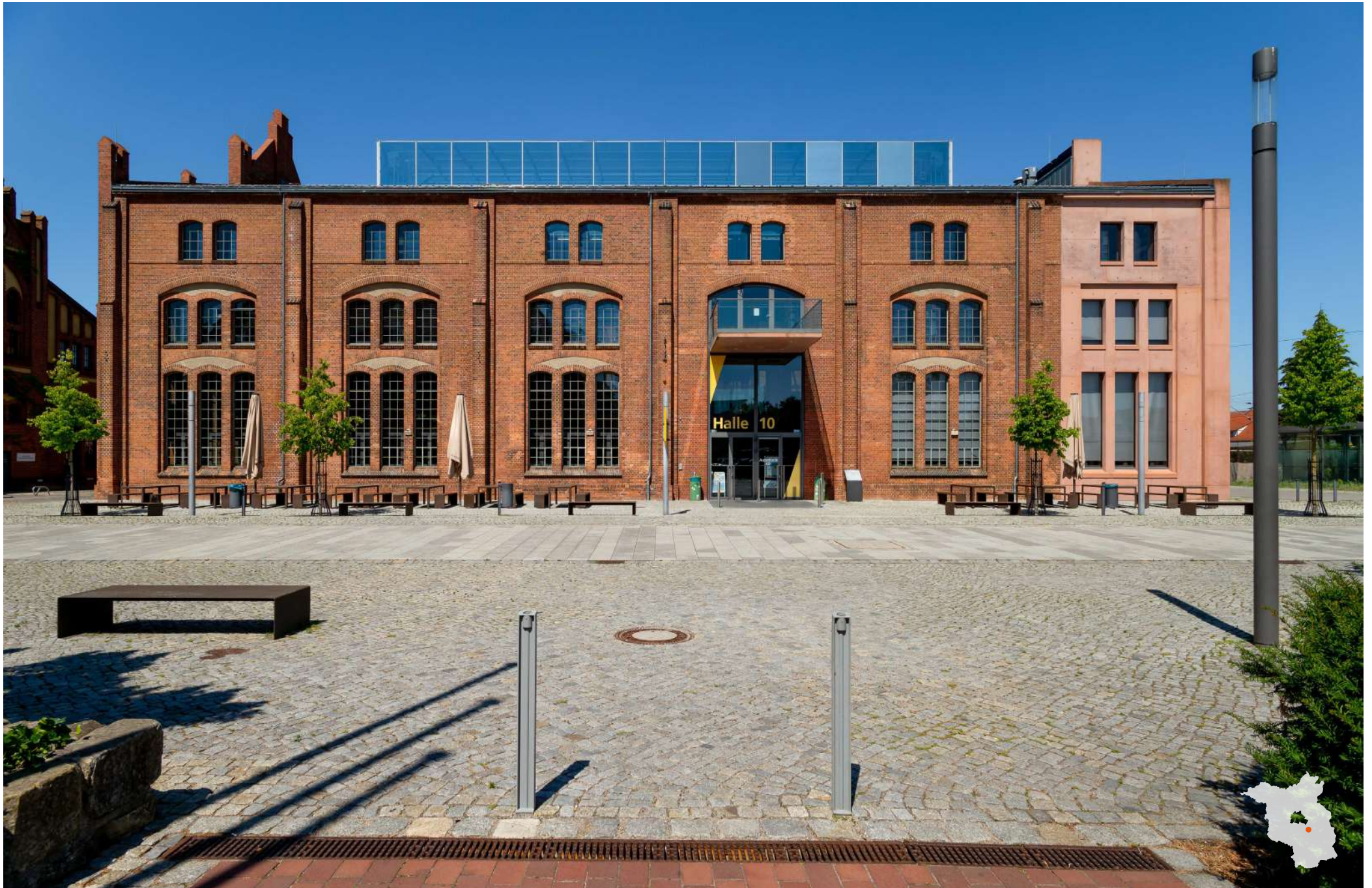
Wildau ehemalige Lokfabrik Schwartzkopff, jetzt TH Wildau