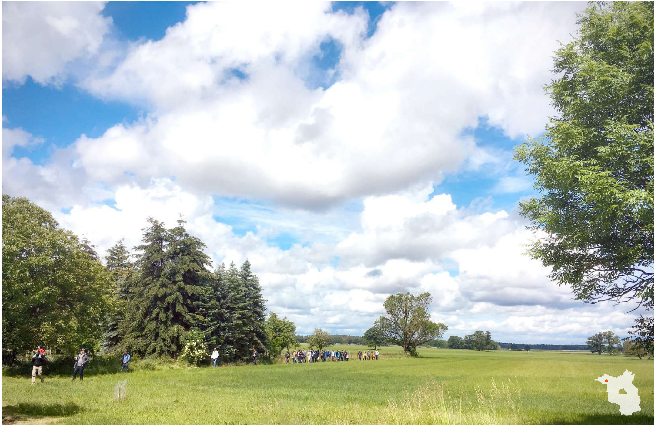
Baukultur Picknick in Nebelin