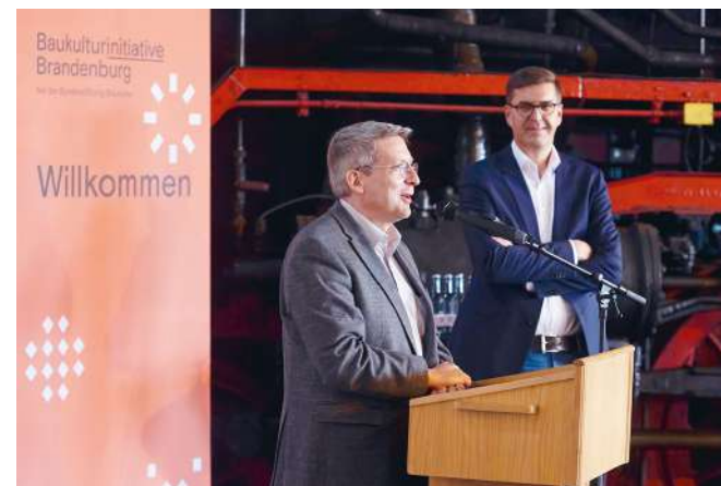
Baukultur im Ort in Wittenberge