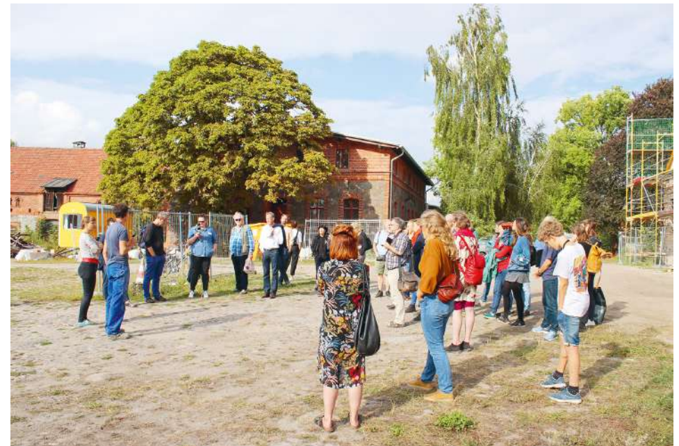
Baukultur Picknick auf dem Hof Prädikow

In der Erklärung von Davos formulierten die europäischen Kulturminister:innen im Jahr 2018 Leitsätze für eine hohe Baukultur in Europa. Davon ist auch das Grundverständnis der Baukulturinitiative Brandenburg geprägt. Den Ansprüchen an eine entsprechende baukulturelle Praxis können die Mitwirkenden jedoch nur gerecht werden, wenn auch die wesentlichen Rahmenbedingungen des Landes Brandenburg berücksichtigt werden: das baukulturelle Erbe und die baukulturelle Gegenwart, das Spannungsverhältnis zwischen wachsenden und schrumpfenden Regionen sowie die Struktur des lokalen und regionalen Engagements.