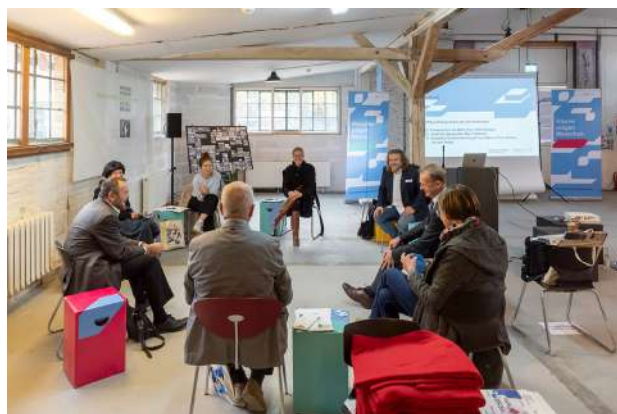
Baukulturdialog der Bundesstiftung Baukultur in Kooperation mit der Baukulturinitiative Brandenburg in Velten