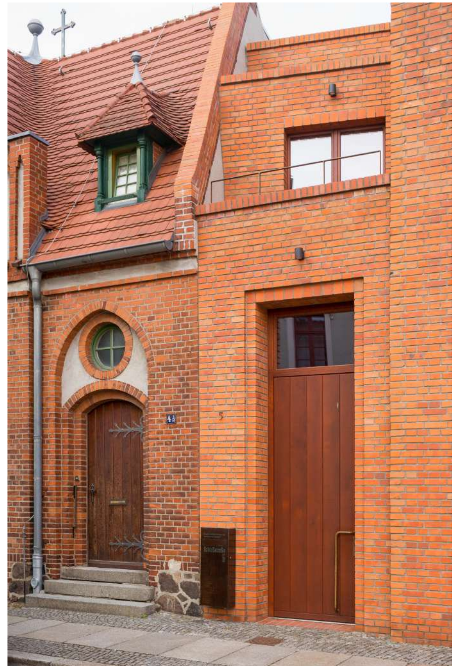
Finsterwalde, Evangelisches Gemeindehaus, Gewinner des Brandenburgischen Baukulturpreises 2017

Mittel, die eindeutig und dezidiert im Sinne einer hohen Baukultur verwendet werden, belaufen sich für das Jahr 2019 auf eine Größenordnung von ungefähr 12,5 Millionen Euro. Davon entfallen fast 86 Prozent auf die institutionelle Denkmalpflege, ungefähr zehn Prozent auf das Wettbewerbswesen und etwa vier Prozent auf die allgemeine Beteiligung der Zivilgesellschaft mit dem Ziel einer umfassend informierten und mündigen Öffentlichkeit.