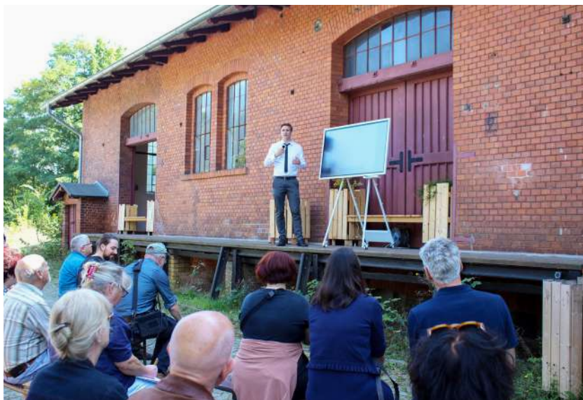
Baukultur Picknick in Wiesenburg

Mit nachhaltigem und verantwortungsvollem Bauen wird das Land den naturräumlichen und ökologischen Belangen in den drei Brandenburger UNESCO-Biosphärenreservaten gerecht. Die zuständigen Ministerien unterstützen die lokalen und regionalen Baukulturschaffenden, sodass die von langer Siedlungstradition und reicher Baukultur geprägten Kulturlandschaften Brandenburgs geschützt und weiterentwickelt werden.