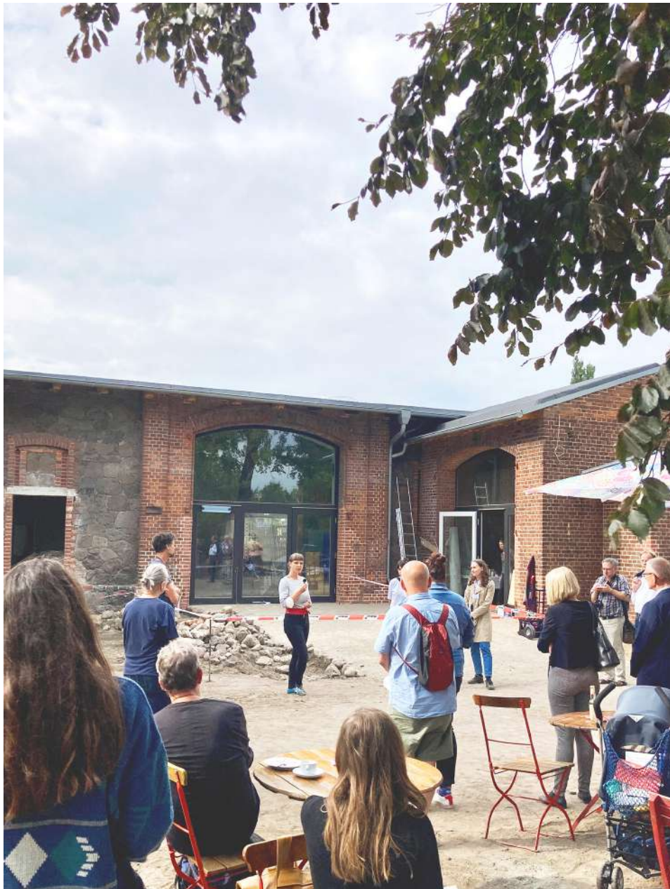
Baukultur Picknick auf dem Hof Prädikow