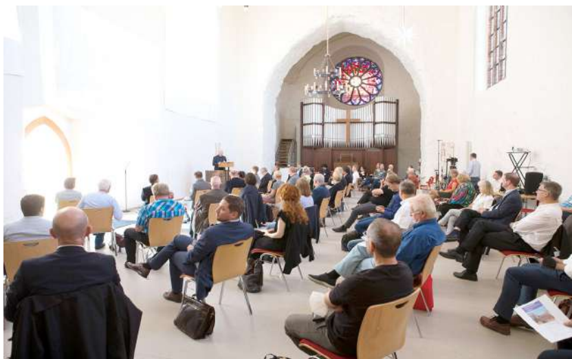
Tagung Dorfkirchen in Prenzlau

Die Tagungen des Fördervereins Baukultur Brandenburg richten sich an ein interdisziplinäres Fachpublikum und thematisieren aktuelle Fragestellungen und Herausforderungen der Baukultur in Brandenburg. Im Fokus der Veranstaltungen stehen bauliche und landschaftliche Charakteristika der Baukultur in Brandenburg, ihre Bewahrung und ihre zukünftige Nutzung. In einem Austausch zwischen Akteur:innen aus Politik, Baupraxis und Wissenschaft werden gemeinsam Lösungsvorschläge erarbeitet und veröffentlicht. Gleichzeitig stellen die Tagungen eine wichtige Möglichkeit zur Stärkung des Netzwerks der Baukulturschaffenden in Brandenburg dar.