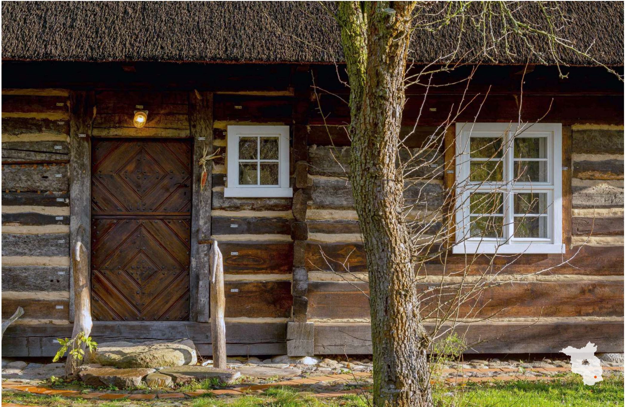
Burg Annemarie-Schulz-Haus (transloziertes Wohnstallhaus von 1726)