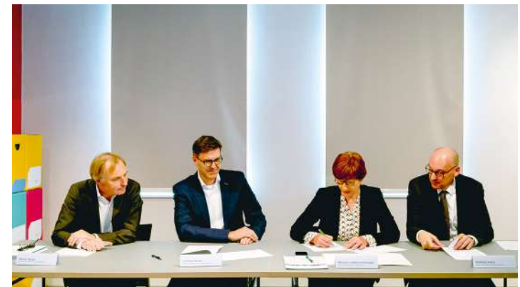
Unterzeichnung der Kooperationsvereinbarung für die Baukulturinitiative Brandenburg

Gründung: Mai 2019 Initiatoren: Ministerium für Infrastruktur und Landesplanung des Landes Brandenburg (MIL), Brandenburgische Architektenkammer (BA), Brandenburgische Ingenieurkammer (BBIK)