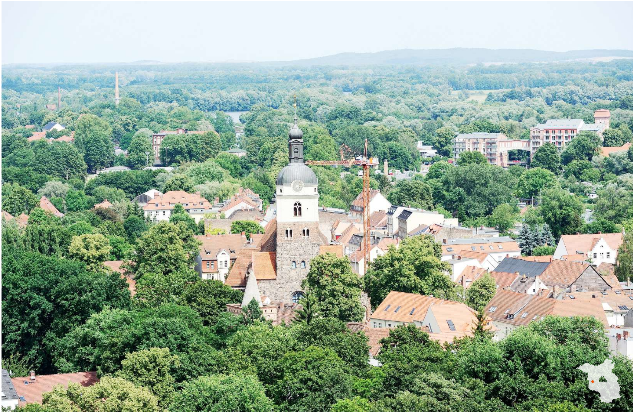
Brandenburg an der Havel Blick auf die St.-Gotthard Kirche