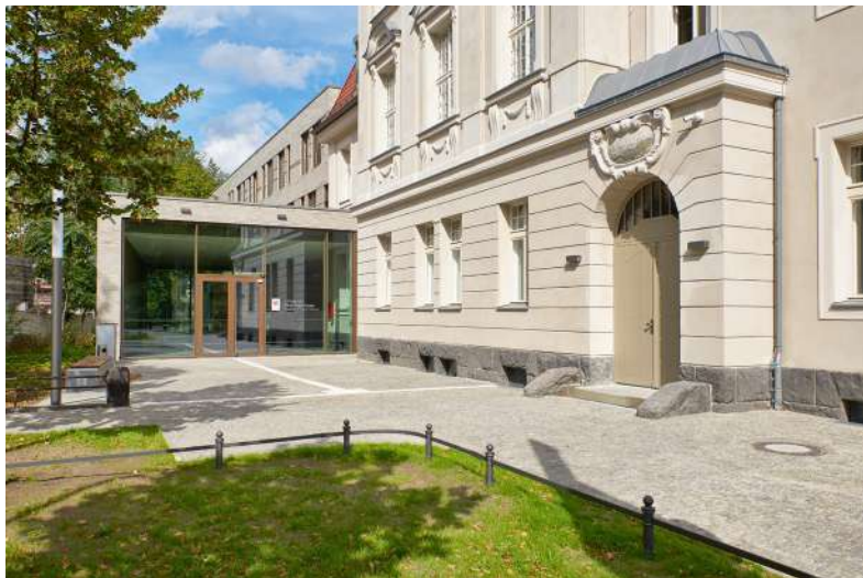
Königs Wusterhausen, Amtsgericht, Gewinner des Brandenburgischen Baukulturpreises 2021

Gespräche Baukultur vor Ort ist eine Veranstaltungsreihe, die mit Bezug auf die preisgekrönten Objekte des Baukulturpreises in den Zwischenjahren der Preisverleihung stattfindet. Die im Rahmen dieses Formats thematisierten Gebäude und Anlagen von hoher baukultureller Qualität werden am ihrem jeweiligen Entstehungs- und Wirkungsort öffentlich präsentiert und diskutiert.