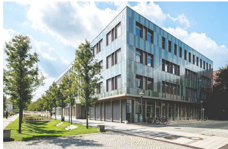
Potsdam, Fachhochschule Potsdam

Stattdessen wäre es in diesem Kontext naheliegend, die Rolle von Wettbewerben in Architektur und Ingenieurwesen in den Blick zu nehmen. Obwohl die im Rahmen von Wettbewerben ausgelobten Planungen auf eine zweckgerichtete, bauliche Investition abzielen, sind Wettbewerbsverfahren ein äußerst geeignetes Mittel der Kommunikation zwischen Fachleuten und Laien sowie der frühzeitigen Information und sogar Einbindung der Öffentlichkeit. Abgesehen davon, gelten Planungswettbewerbe nach wie vor als bewährtes Instrument einer hohen Baukultur. Sie sichern hohe Entwurfsqualität, Funktionalität und individuelle Gestaltung, somit essentielle Faktoren guter Architektur, und tragen durch die