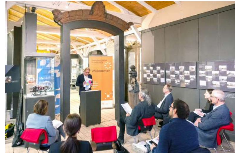
Übergabe des Veltener Fünf-Punkte-Plans

Seit Mai 2019 wird die Arbeit der Baukulturinitiative Brandenburg durch eine Geschäftsstelle koordiniert, die bei der Bundesstiftung Baukultur in Potsdam angesiedelt ist. Sie ist verantwortlich für die Öffentlichkeitsarbeit der Baukulturinitiative Brandenburg, organisiert die Veranstaltungen sowie die Zusammenarbeit der Kooperationspartner und verwaltet die Finanzen der Baukulturinitiative. Die Geschäftsstelle als gemeinsame, zentrale Anlaufstelle steuert