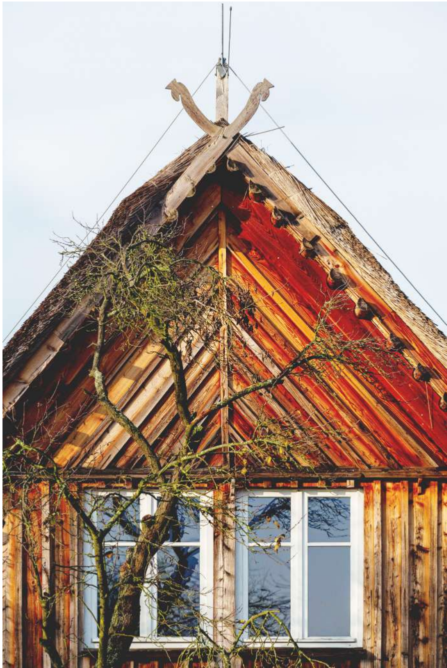
Burg, Spreewald Kräuterey