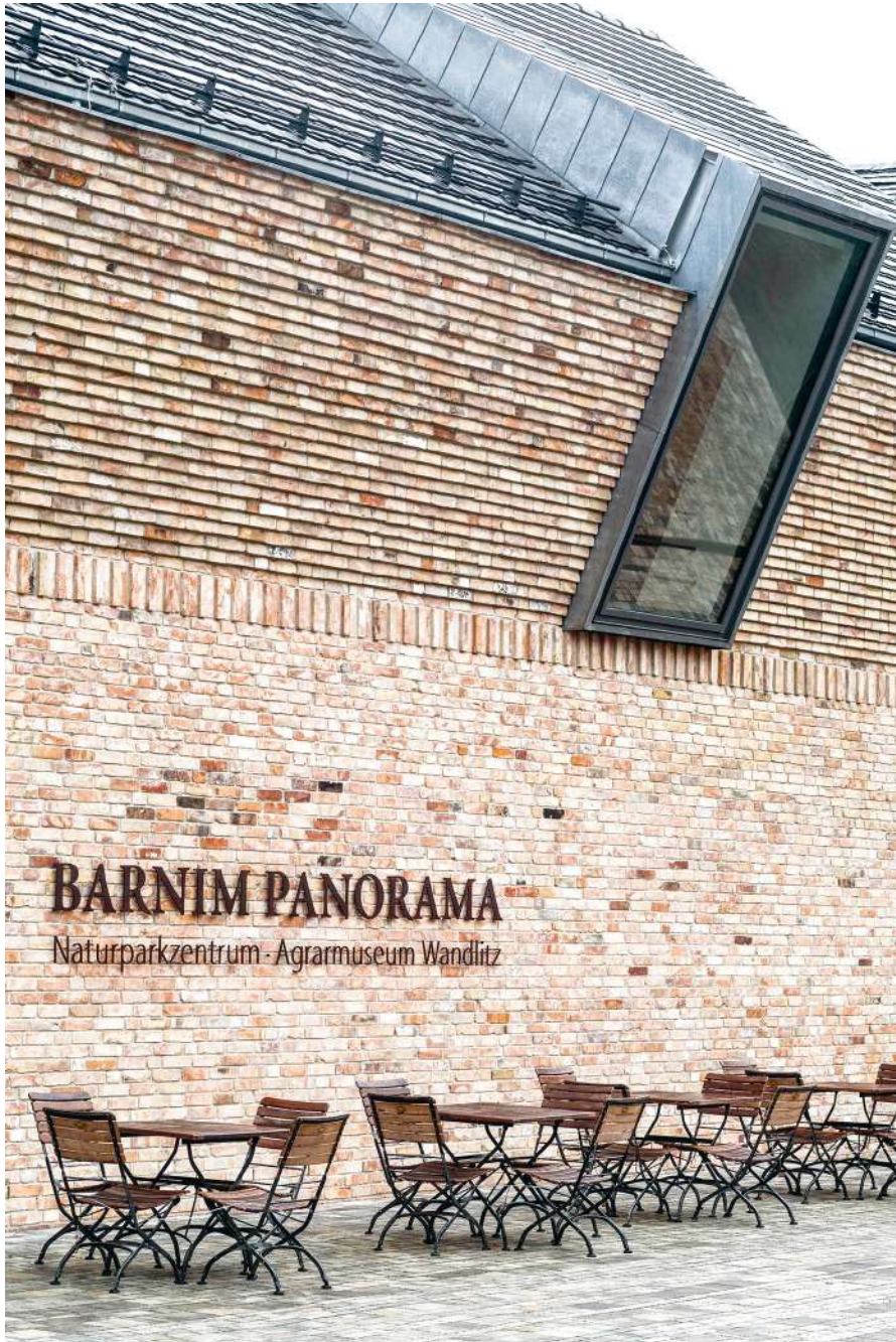
Wandlitz, Barnim Panorama Naturparkzentrum - Agrarmuseum Wandlitz