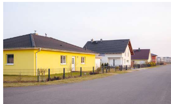
...bei zeitgleichem, stetigem Wachstum von Wohngebieten am Stadtrand.