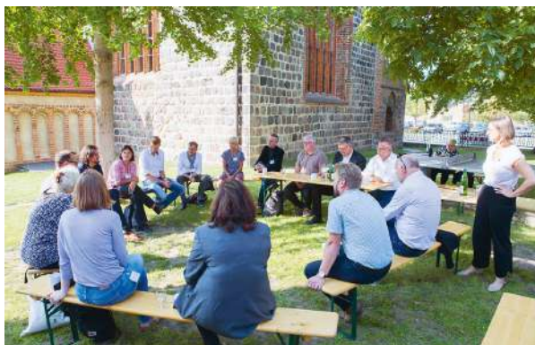
Tagung Dorfkirchen in Prenzlau

Dieser Gedanke leitet auch die Arbeit der Baukulturinitiative Brandenburg und des Fördervereins Baukultur Brandenburg. Im Bewusstsein, dass die Initiator:innen lediglich mittelbaren Einfluss auf die Planungs- und Bautätigkeiten im Land Brandenburg nehmen können, ist die Förderung einer Gesprächskultur im Land umso wichtiger. Es gilt, dem Anspruch einer hohen Baukultur auch auf der Ebene des gesellschaftlichen Miteinanders gerecht zu werden. Aus dieser Perspektive wächst den Instrumenten der Vermittlung, der Beteiligung sowie dem fachlichen und sachlichen Diskurs eine besondere Bedeutung zu, auch und besonders im Hinblick auf die Fördermaßnahmen.