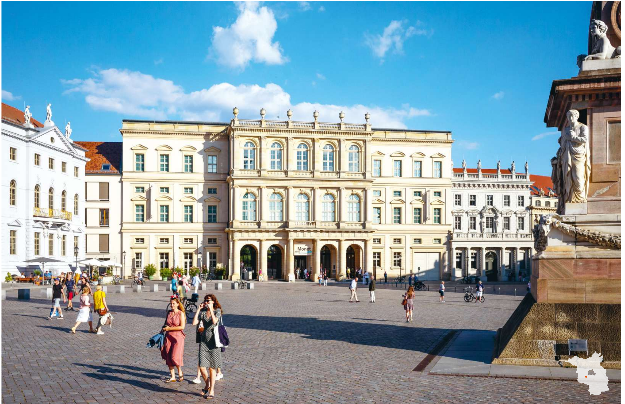
Potsdam Alter Markt