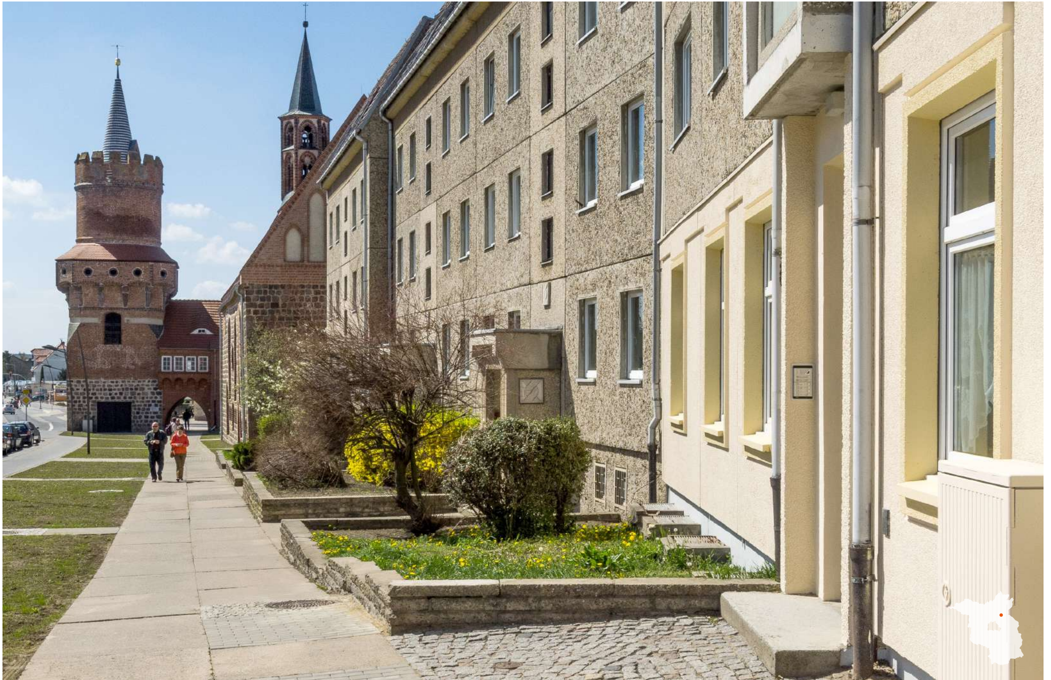
Prenzlau Marktberg mit Mittelorturm und Heiliggeistkapelle