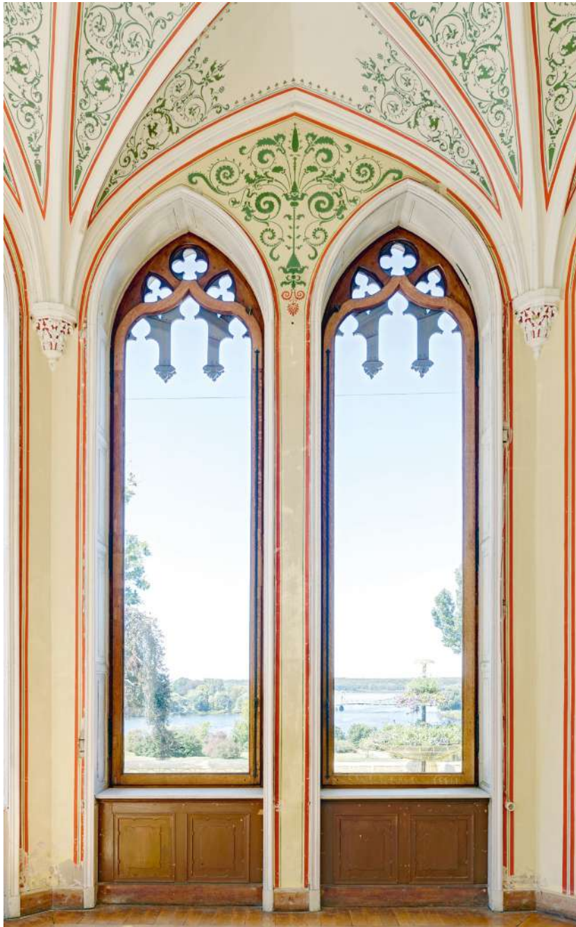
Potsdam, Schloss Babelsberg