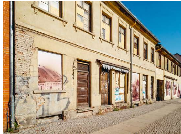
Der „Donut-Effekt“/ Leerfallende Ortskerne mit Funktionsverlust...

dieser historisch gewachsenen Zentren sollte deshalb gerade bei der jungen Generation, aber auch bei Familien und privaten Bauherrschaften mit Interesse an einem Eigenheim geweckt und gestärkt werden.