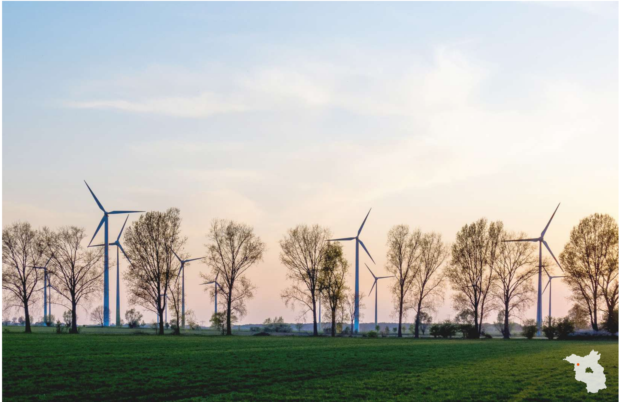
Bei Bückwitz Windkraftanlagen