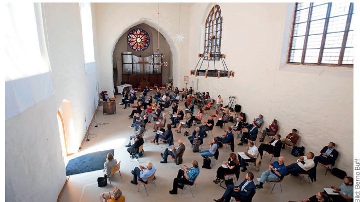
Tagung „Dorfkirchen – geliebt, aber akut bedroht“ in Prenzlau

Nicht für jede der 1500 Dorfkirchen wird es eine schnelle und befriedigende Lösung geben. Es ist deshalb wichtig, nicht in Aktionismus zu verfallen: Die meisten der mittelalterlichen Dorfkirchen haben schon schwerere Zeiten erlebt und dennoch mehr als 600 Jahre überdauert. Anstatt finale Lösungen anzustreben, ist es in vielen Fällen wichtiger, sich kontinuierlich zu kümmern. Alle Kirchen – auch solche ohne klare Nutzungsperspektive – müssen regelmäßig (mindestens zweimal im Jahr) begangen werden. Schäden müssen unverzüglich dem Kirchenkreis gemeldet werden, um diese kostengünstig zu einem möglichst frühen Zeitpunkt zu beheben. Hierzu wurde ein Musterbegehbungsbericht für die vielen Ehrenamtlichen erstellt. Zudem wird eine systematische Bestandserfassung aller Dorfkirchen durch das Kirchliche Bauamt in Abstimmung mit den Kirchenkreisen durchgeführt, um den baulichen Zustand zu katalogisieren und daraus bauliche Maßnahmen abzuleiten. Über weitere finanzielle Fördermöglichkeiten beraten die Landeskirche und die Kirchenkreise die kleinen Kirchengemeinden. Die