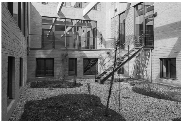
Innenhof Amtsgericht Königs Wusterhausen Foto: Abelman Vielain Pock Architekten Partnerschaft mbB

Mit dem Sonderpreis ausgezeichnet wurden die Gewölbebrücke über die schwarze Elster (bei Neudeck), das Alexander Haus in Potsdam sowie die Mensa Klosterfelde (Gemeinde Wandlitz).