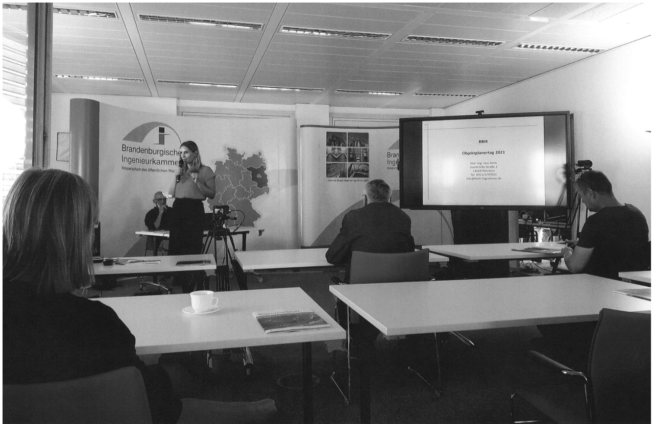
Digitaler Objektplanertag direkt aus dem Studio der BBIK