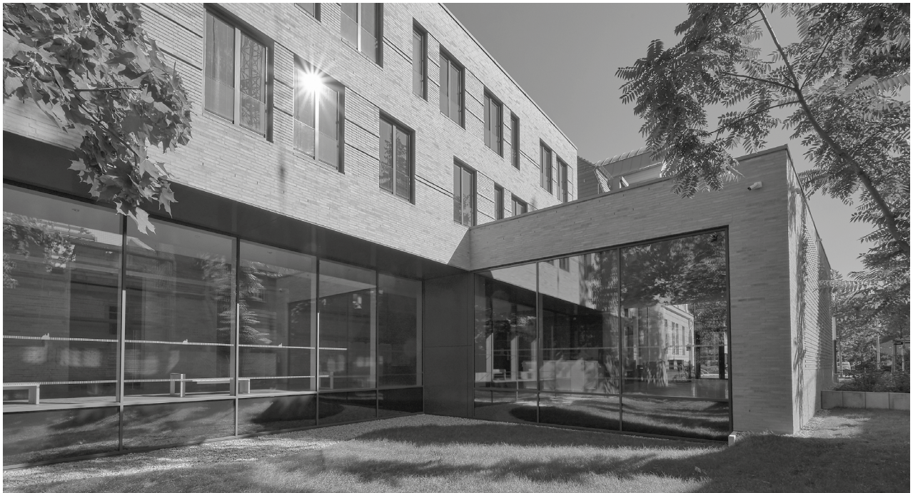
Amtsgericht Königs Wusterhausen | Foto: Abelmann Vielain Pock Architekten Partnerschaft mbB

Der diesjährige Brandenburgische Baukulturpreis geht an einen Ort mit viel Geschichte: das Amtsgericht Königs Wusterhausen wurde 1894 in unmittelbarer Nachbarschaft zum Schloss errichtet und dokumentiert so die Geschichte der Rechtsprechung aus dem Kaiserreich bis heute. Folgerichtig wurde das gesamte Ensemble als Denkmal erkannt und vor Beginn der Arbeiten an einem Erweiterungsbau unter Schutz gestellt.