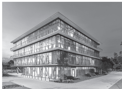
Innovation Center 2.0 © SCOPE Architekten

ELT: Ruß Ingenieurgesellschaft mbH, Berlin