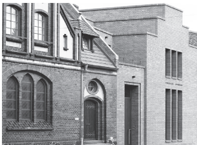
Baukulturpreis 2017, Gemeindehaus-Ensemble © Habermann-Architektur