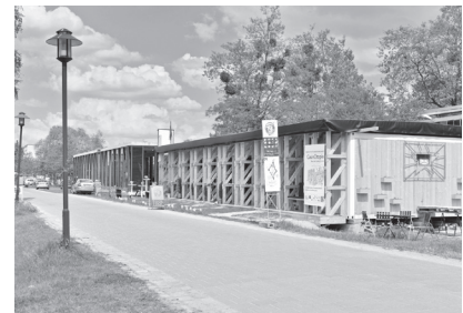
Interimsbau Studentencafé © FH Potsdam

Errichtung eines Interimsneubaus für ein Studentencafé durch Studierende der Fachbereiche Kulturarbeit, Bauingenieurwesen, Architektur, Restaurierung und Design der Fachhochschule Potsdam.