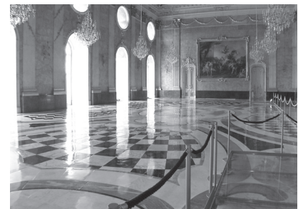
Neues Palais Potsdam

Wegen schwerwiegender Schäden an der historischen Holzdeckenkonstruktion mit einer Spannweite von über 18 m wurde eine technisch besonders anspruchsvolle Sanierung der barocken Deckenbereiche zwischen dem Marmorsaal und dem darunterliegenden Grottensaal des