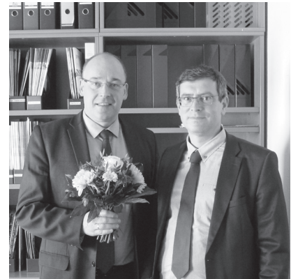
Begrüßung RA Schüler

Im Eintragungsausschuss arbeiten fachlich befähigte Ingenieure und Juristen zusammen, um über die Eintragung in die Listen der Kammermitglieder und der Anwärter sowie die Verzeichnisse zu entscheiden. Die den Vorsitz führende Person und deren Vertretung sollen die Befähigung zum Richteramt oder zum höheren Verwaltungsdienst haben.